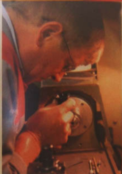
L'entreprise GAUTHIER : tout le savoir-faire en mécanique de haute précision.

E quipée de machines à commande numérique de dernière génération, d'un centre de programmation et de contrôle, Gauthier Précisions répond aux exigences les plus avancées des donneurs d'ordre importants de l'industrie de pointe tels que la formule 1, l'aéronautique, l'aérospatiale ou la chirurgie dentaire. Ses savoir-faire dans la mécanique de précision, la micro-mécanique, la mécanique d'optique, la mécanique médicale, la connectique permettent à l'entreprise la réalisation complète de pièces élémentaires et de sous-ensembles de hautes technologies dans des dimensions généralement inférieures à 100 mm, en prototypes, petites ou moyennes séries. De la prothèse dentaire à des constituants de moteur F1, la société s'est spécialisée dans la miniature. Elle usine les matériaux les plus connus comme les plus "exotiques" : aciers inoxydables, métaux ferreux et non ferreux, alliages légers, alliages cuivreux et matières plastiques, alliages titane... Avec un chiffre d'affaires de 2,3 millions